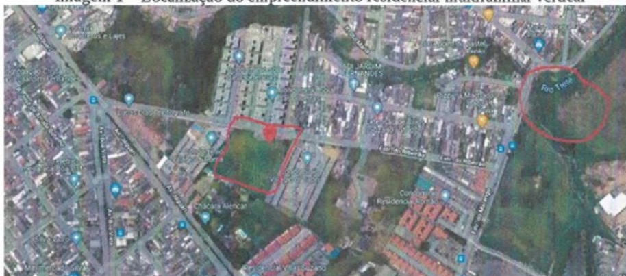
Imagem 1 – Localização do empreendimento residencial multifamiliar vertical

A Estrada do Ribeirão possui 592,0 metros de extensão e 7,20 metros de largura com fluxo de trânsito em mão dupla, interligada com a Avenida Jaguari e com a Estrada do Marengo que são duas vias de grande importância e fluxo da região, Imagem 1. Conforme a mesma Imagem 1 é possível identificar a existência de outros 4 empreendimentos similares, a saber: Condomínio Solar das Hortências, Condomínio Solar das Oliveiras, Condomínio Di Roma e Condomínio Di Capri, todos localizados na mesma Estrada em que será erguido no novo empreendimento residencial multifamiliar vertical.