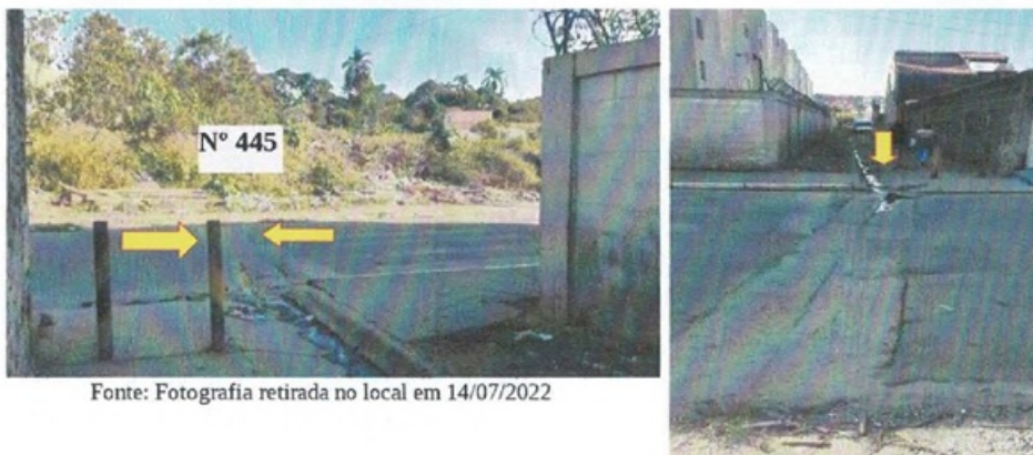
Imagem 4 – Sarjetas coletoras de drenagem superficial direcionadas para o Rio Jaguari