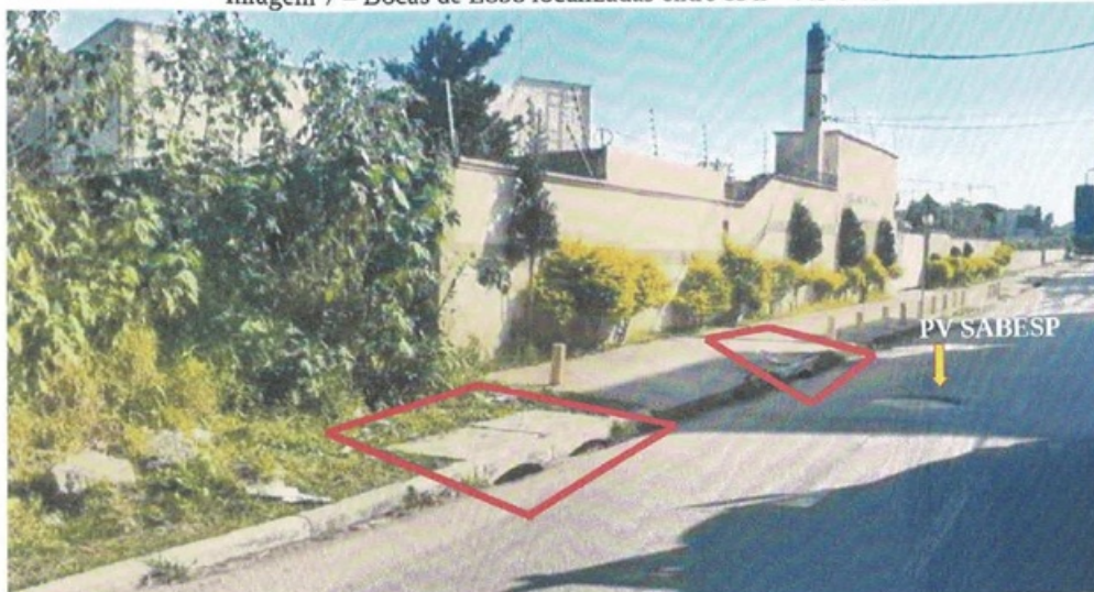
Imagem 7 – Bocas de Lobo localizadas entre os nº 445 e 455