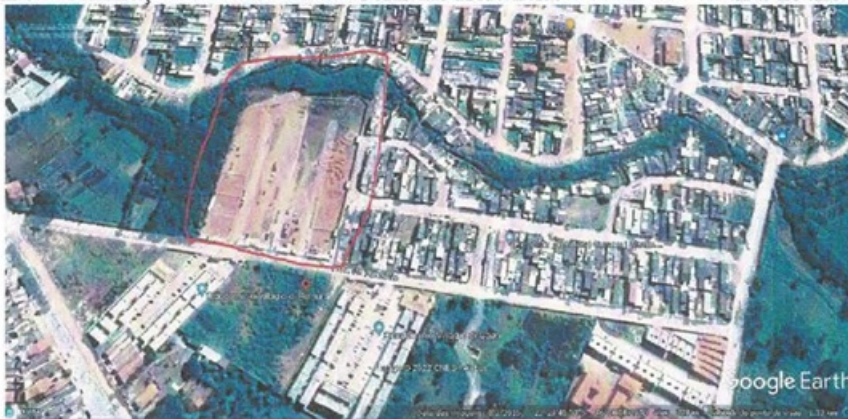
Imagem 3 – Construção dos condomínios Solar das Hortências e Solar das Oliveiras no ano de 2015