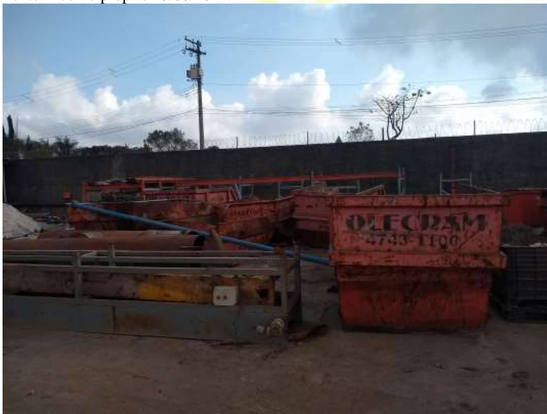
Figura 7: Área Interna, Caçambas. 13/08/2021.