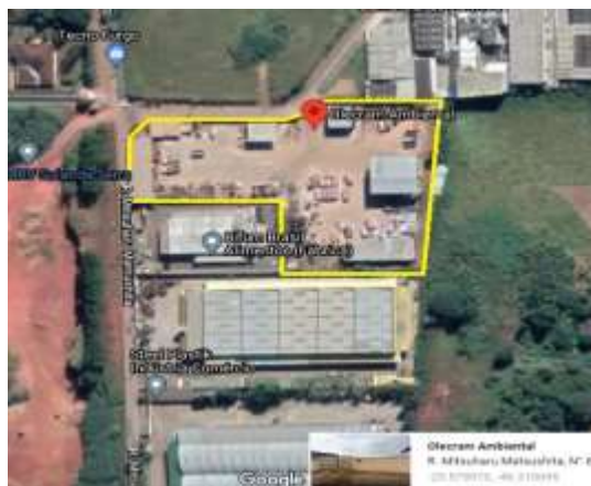
Figura 1: Imagem de Satélite Google Earth – localização do empreendimento. 26/07/2021.