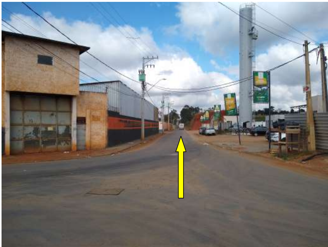
Figura 10: Área externa, Sentido à Entrada principal. Rua Mitsuharu Matsushita. Fonte: Acervo próprio 13/08/2021.