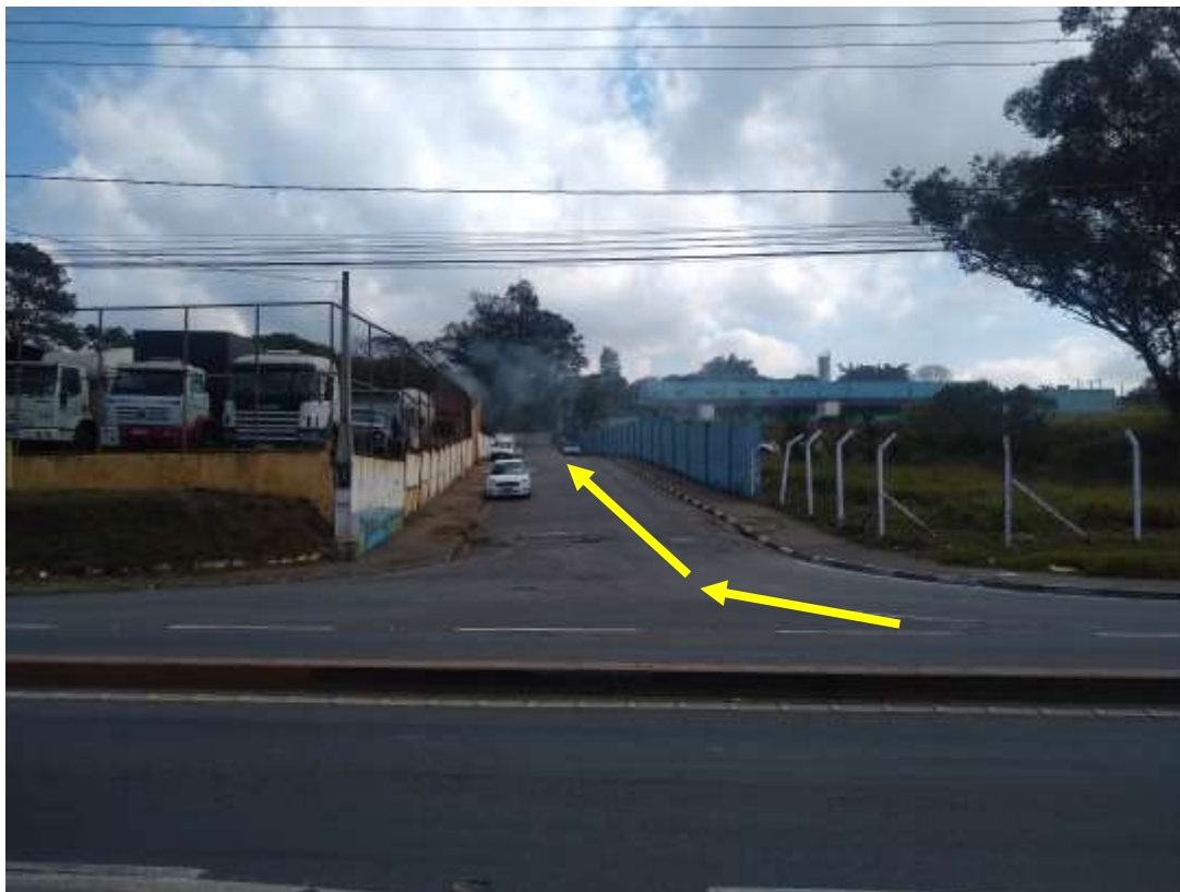
Figura 12: Área externa, Sentido à Estrada Antonio Jorge. Fonte: Acervo próprio 13/08/2021.