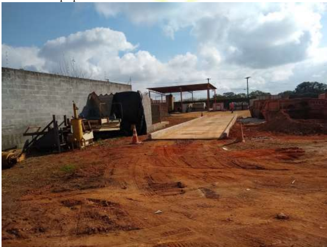
Figura 7: Área Interna, Balança. Fonte: Acervo próprio 13/08/2021.