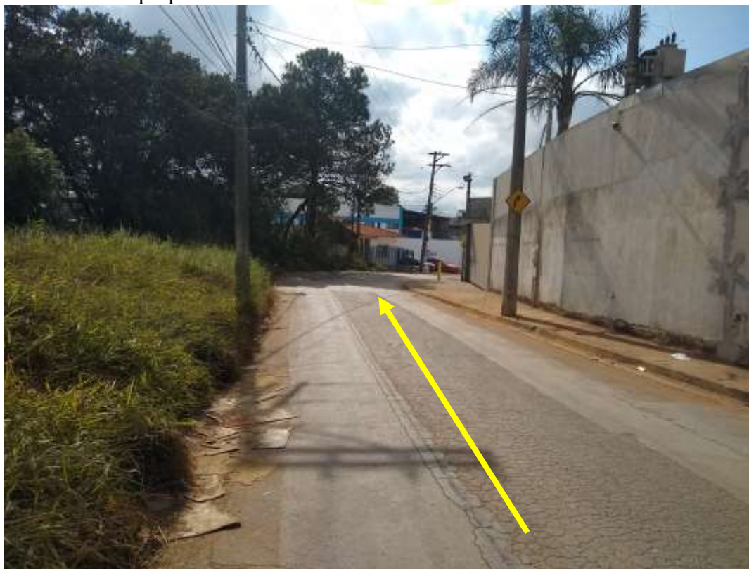
Figura 11: Área externa, Sentido à Estrada Antonio Jorge. 13/08/2021.