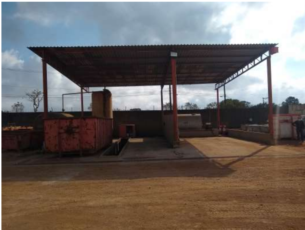
Figura 8: Área Interna, Lavagem de Caminhão.