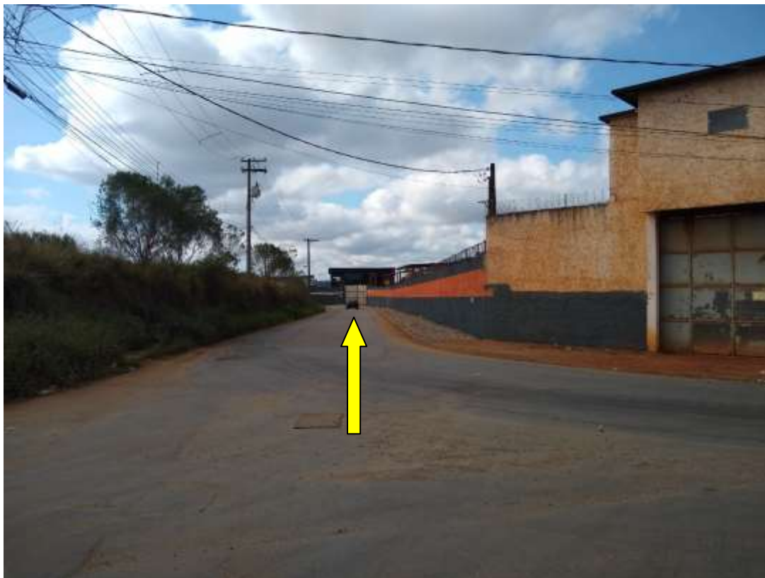
Figura 8: Área externa, Sentido à Entrada principal. Rua Antonio da Surreição. 13/08/2021.