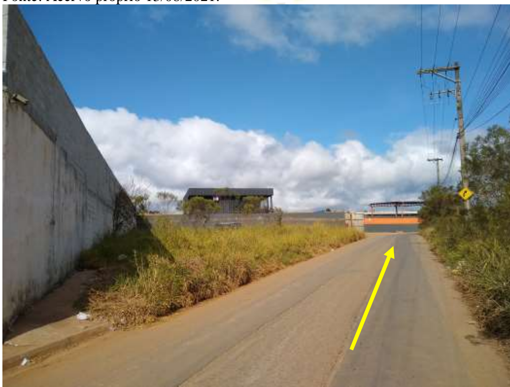
Figura 9: Área externa, Sentido à Entrada principal. Rua Antonio da Surreição. Fonte: Acervo próprio 13/08/2021.