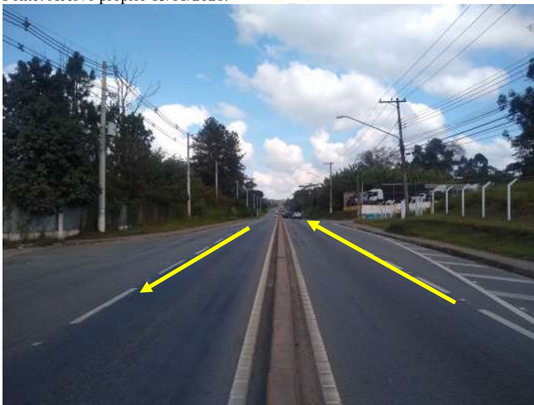
Figura 13: Área externa, Rodovia Índio Tibiriçá.