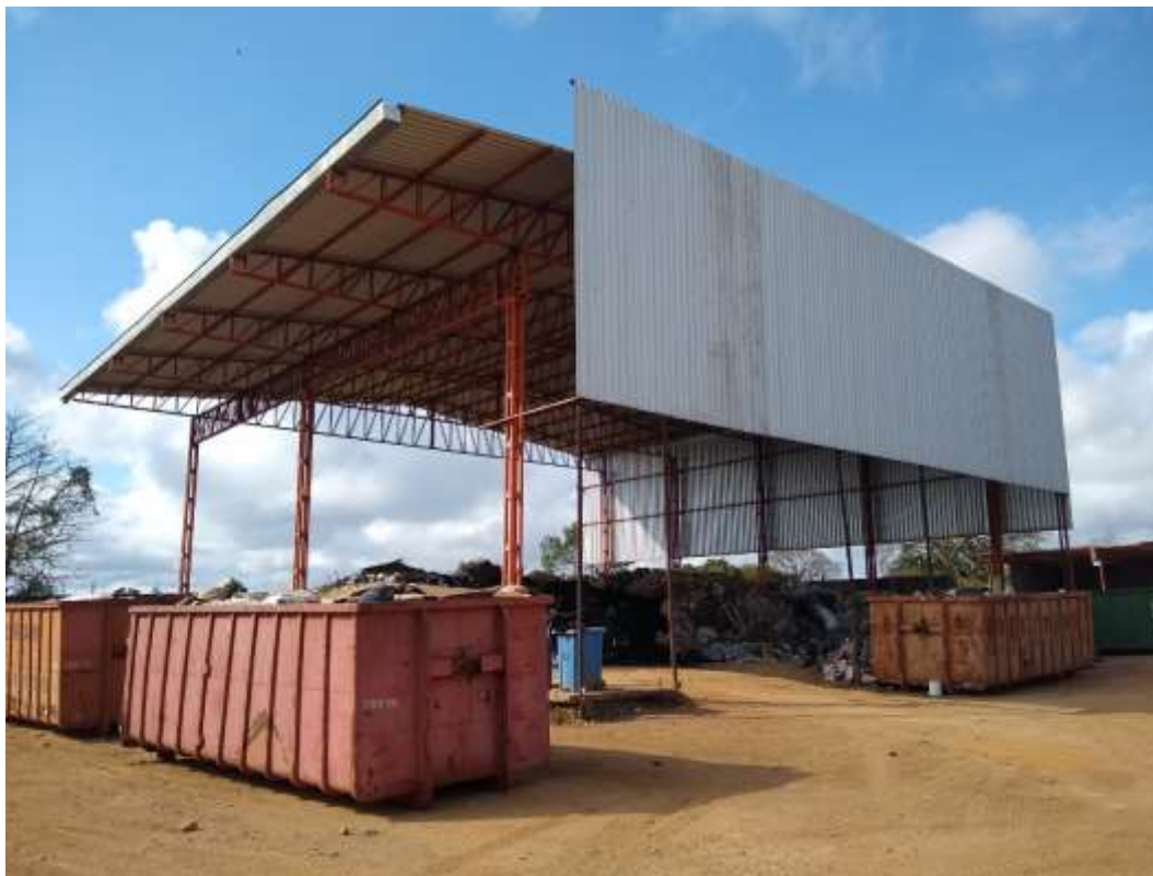
Figura 4: Área Interna, Segregação. 13/08/2021.