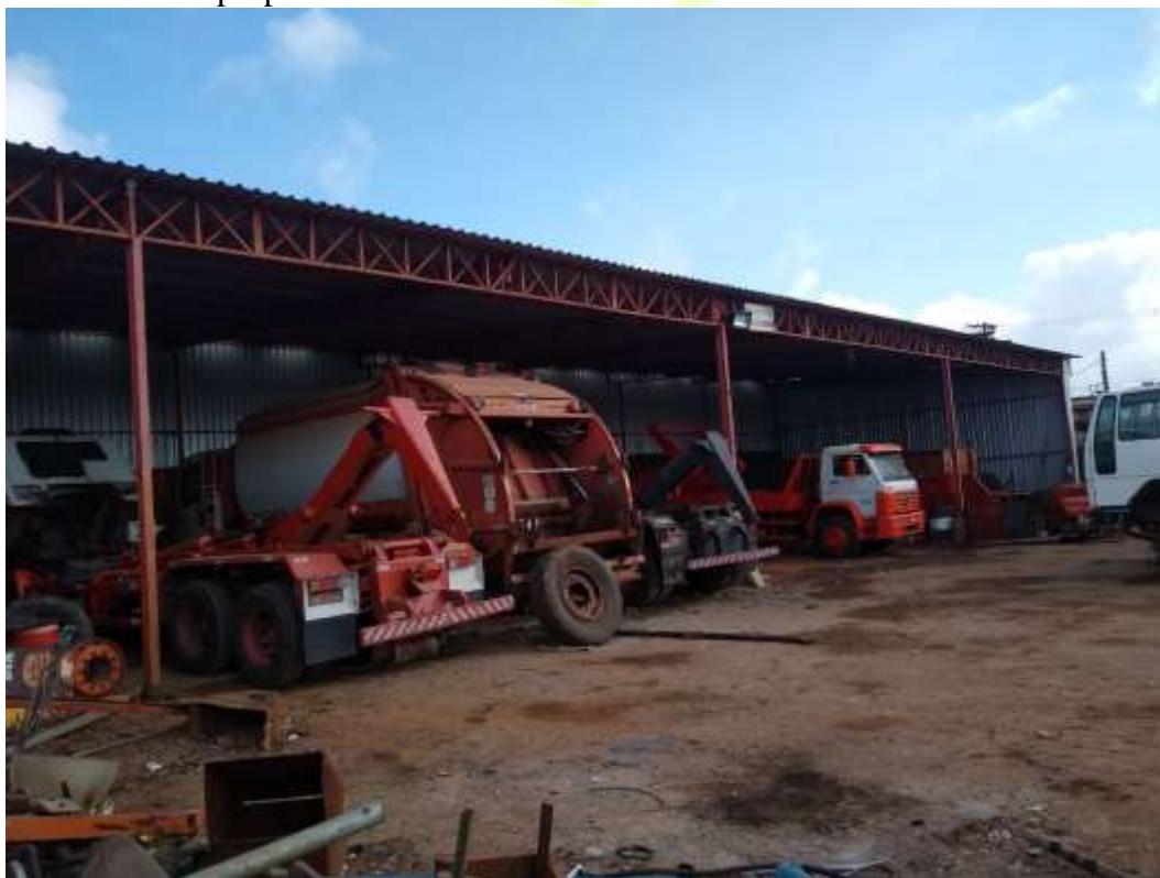
Figura 5: Área Interna, Mecânica 13/08/2021.