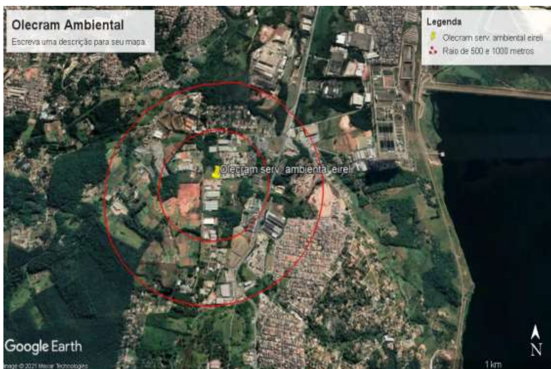
Figura – 2: 28/07/2021

Tratando-se de um empreendimento de pequeno porte, não cria impacto, por se tratar de Área Industrial, gases e ruídos, tudo estabelecido dentro das normas.