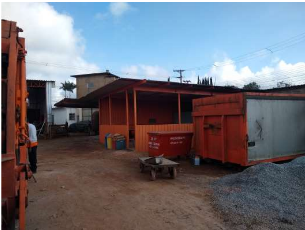
Figura 6: Área Interna, Refeitório. Fonte: Acervo próprio 13/08/2021.