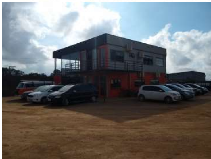
Figura 3: Área Interna, Administrativa Pav. Térreo e superior.