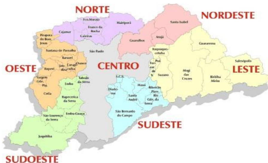
Figura 1 – mapa com localização do município

Situado a leste de São Paulo, a 45 quilômetros da capital, Suzano é um dos 39 municípios que compõem a Região Metropolitana de São Paulo e integra o Alto Vale do Rio Tietê. Possui um potencial produtivo formado por empresas de grande porte, reconhecidas nos mercados internacional e nacional, dispondo de infraestrutura e logística para receber novas indústrias. Limita-se ao norte com Itaquaquecetuba, ao sul com Santo André e Rio Grande da Serra, a Leste com Mogi das Cruzes e a Oeste com Poá, Ferraz de Vasconcelos e Ribeirão Pires. Como todos os municípios da região, Suzano apresenta alta taxa de migração, principalmente nos bairros limítrofes.