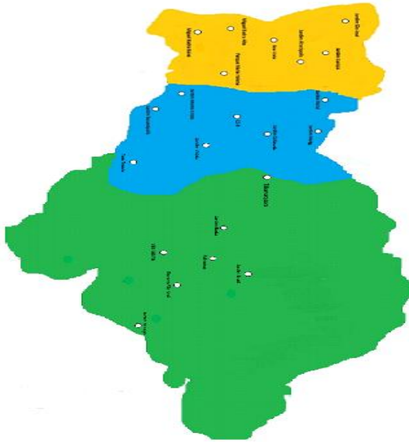
Figura 5 - Unidades Básicas de Saúde distribuídas nos distritos